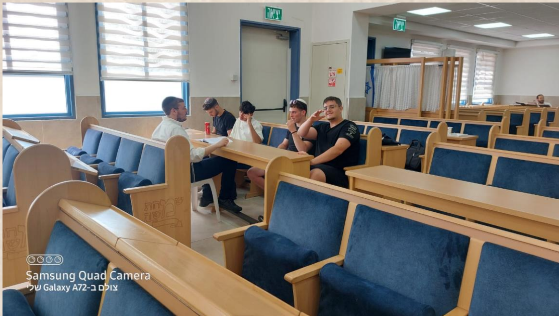
Samsung Quad Camera צולם ב-Galaxy A72 שלי