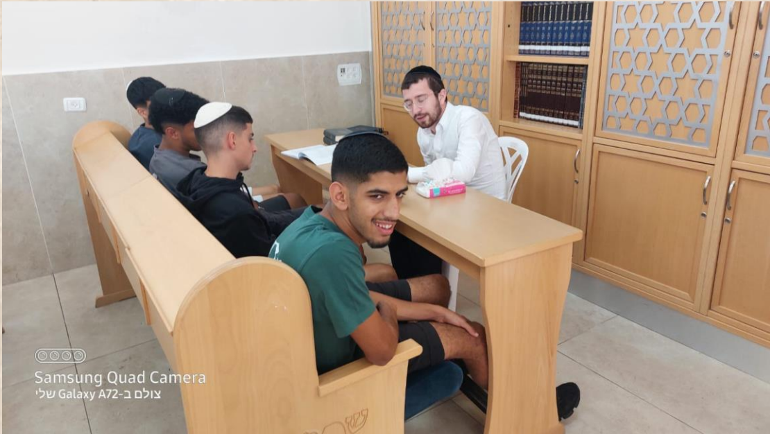
Samsung Quad Camera צולם ב-Galaxy A72 שלי