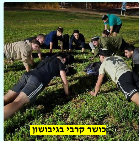
כושר קרבי בגיבושון