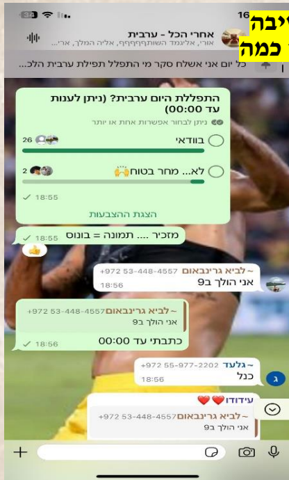
מיזם חדש - "אחרי הכל - ערבית" - תלמידי הישיבה הולכים להתפלל ערבית, ומשתתפים בהגרלה מדי כמה שבועות למתמידים שבהם. (11/11/24)