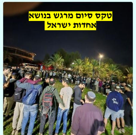
טקס סיום מרגש בנושא אחדות ישראל