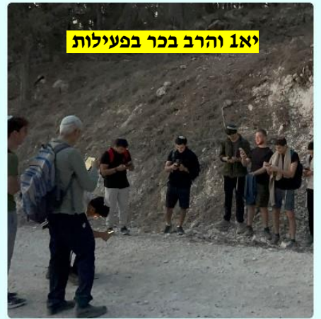
יא1 והרב בכר בפעילות