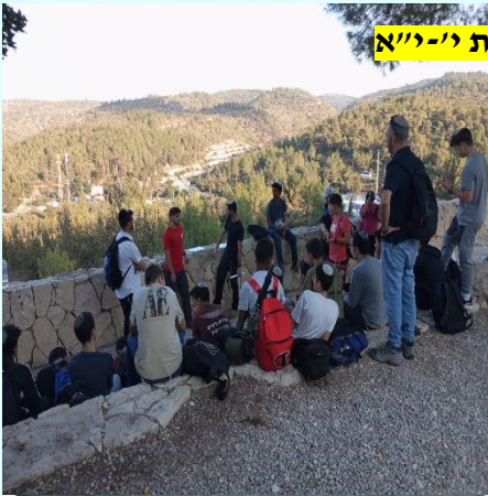
השמיניסטים מעבירים פעילות חינוכית לכיתות י'-י"א