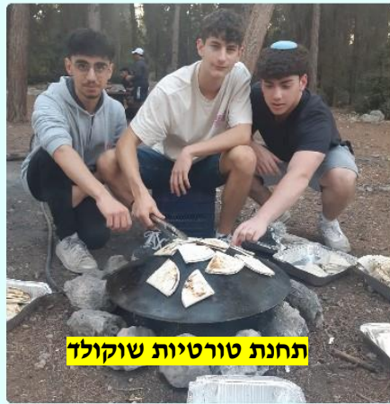
תחנת טורטיות שוקולד