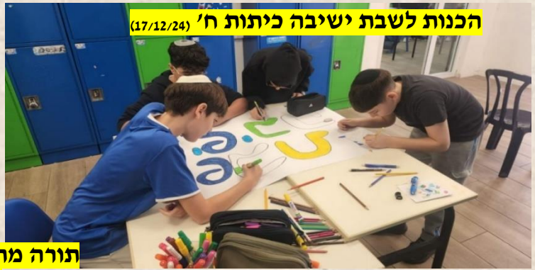
הכנות לשבת ישיבה כיתות ח' (17/12/24)