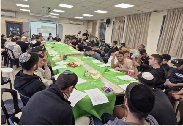
התוועדות לכבוד חנוכה כיתות י' (23/12/24)