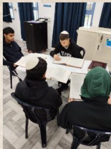
שבת ישיבה - שכבה ט'

בשבת פרשת משפטים, יצאו תלמידי שכבה ט' לשבת ישיבה באכסניית אני"א רבין בירושלים. האווירה הייתה מחממת, לוי"ז שכלל שיחות ושות"ים, ארוחות טובות, וגיבוש נפלא בין הצוות והתלמידים.