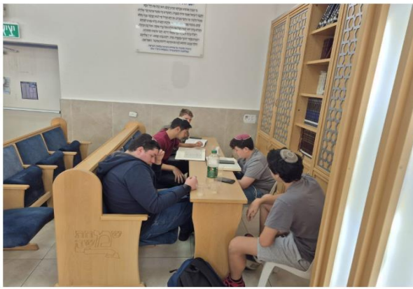
חברת קודש בגמרא - לומדים עם האברכים גמרא בעיון (26/3/25)