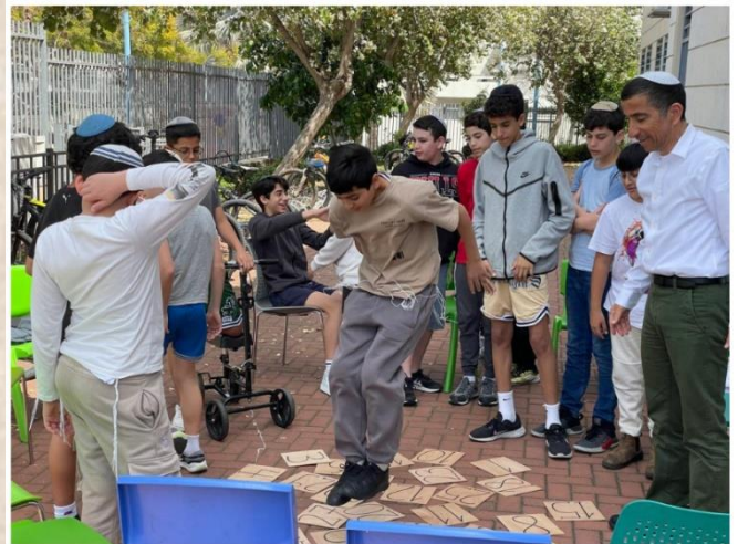
תוכנית צמיחה אישית בכיתות w2 - עבודה ותרגול בצורך עומק: אוטונומיה (26/3/25)