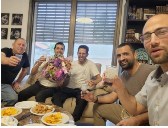
ביקור בביתו של הרב חגי הי"ו (1/4/25)