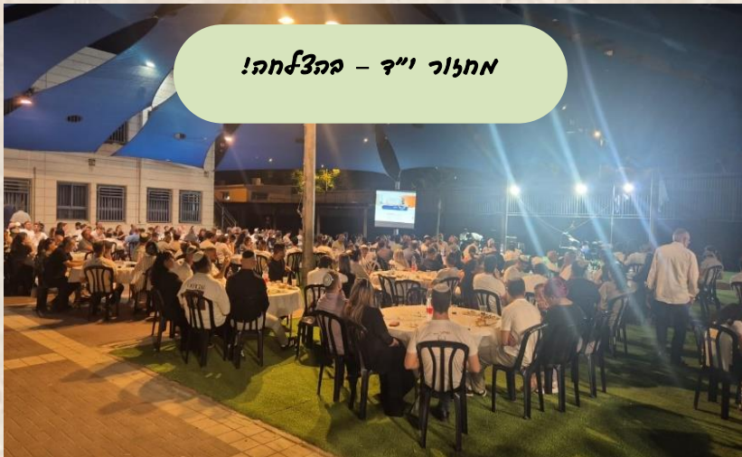
אחזור וי"ד - בהצלחה!