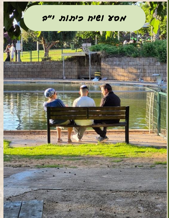
אסצ וסיח כיתות ו"ב