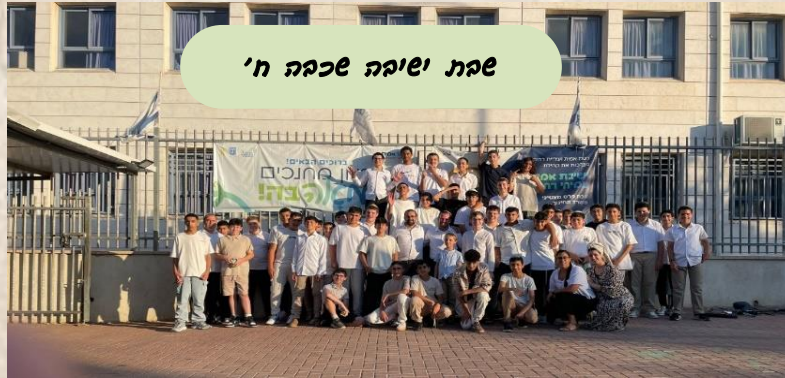
שבת ישיבה שכבה ח'