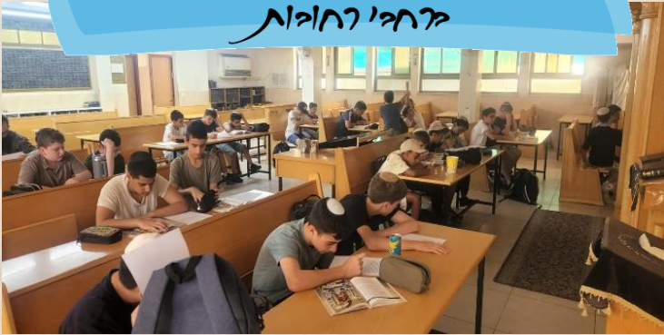
שכבה ז' בסיוור האכות מפילה ברחבי רחובות